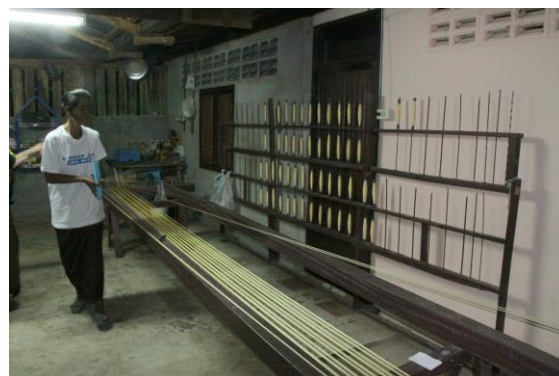
Opzetten van de kettingdraad (boven) en Lea in gesprek met een van de weefsters (onder)